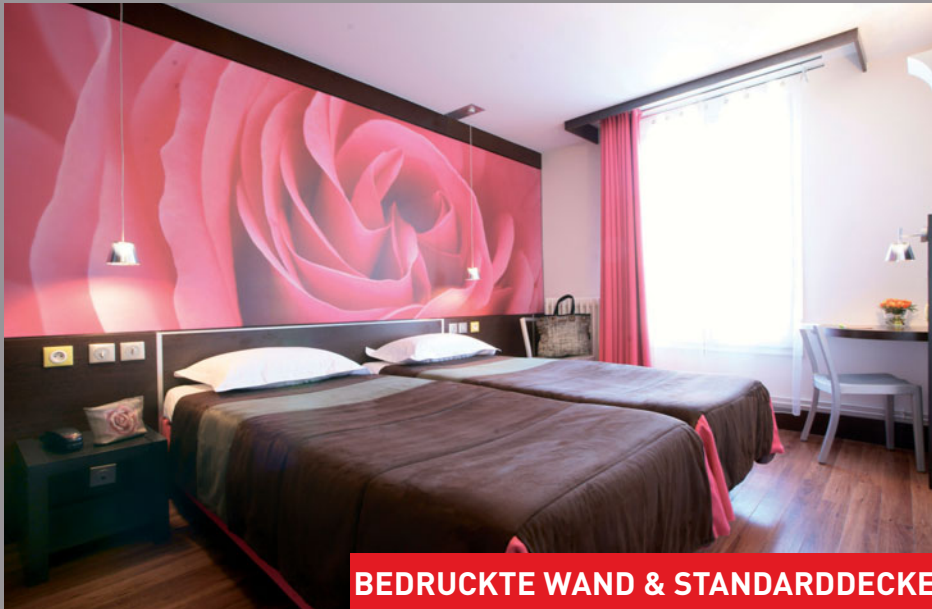
BEDRUCKTE WAND & STANDARDDECKE

Hotel du Parc (Frankreich) - Architekt: Fabrice Antore