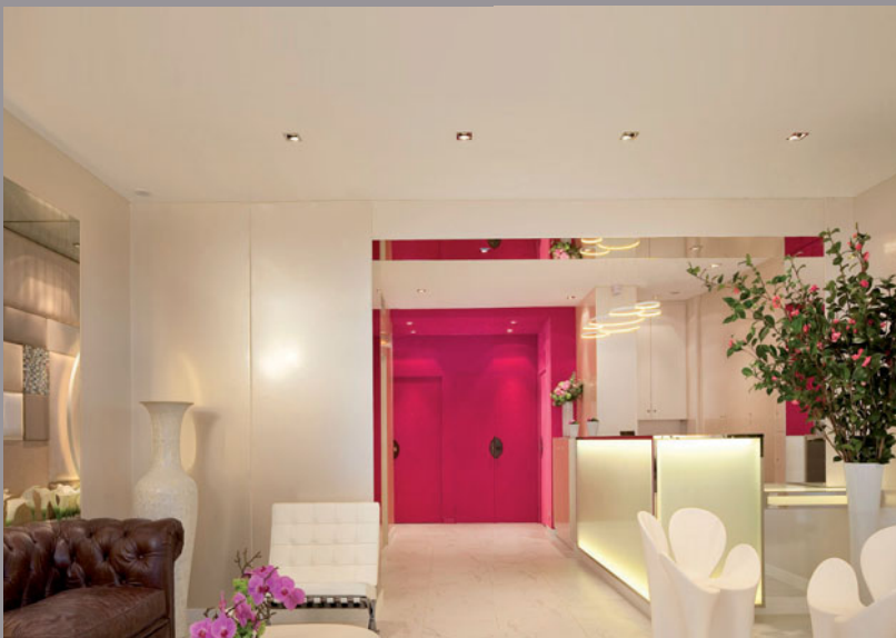
Hotel Eiffel Park (Frankreich) Fotos: Christophe Bielsa für das Hotel 7Eiffel - Gestaltung: Silva Création