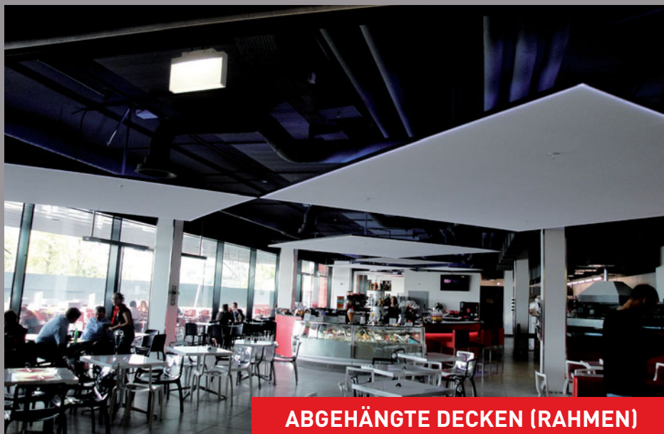
ABGEHÄNGTE DECKEN (RAHMEN)

Hotel du Parc (Frankreich) - Architekt: Fabrice Antore