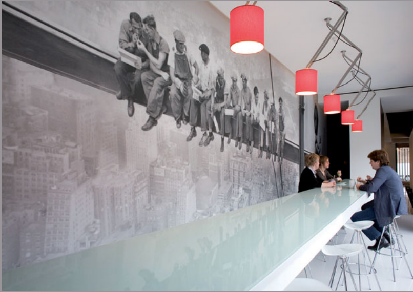
Betriebsrestaurant (Belgien) Architekt: Lineos-Chris Vantornout - Gestaltung: Mona Visa