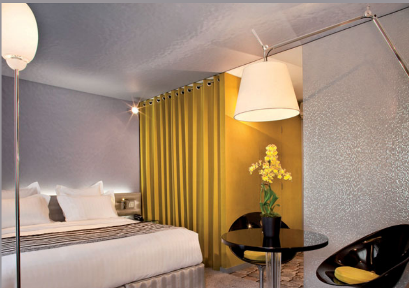
Hotel Eiffel Park (Frankreich) Gestaltung: Silva Création