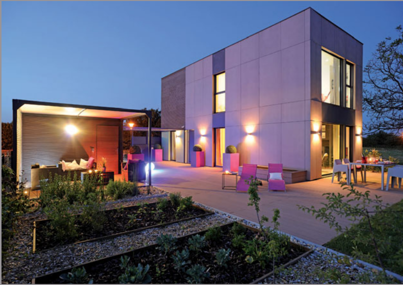
Musterhaus Modulife (Frankreich) - Wände und Decken von CLIPSO Durchführung: Unternehmensgruppe MCP, MODULIFE-Technologie