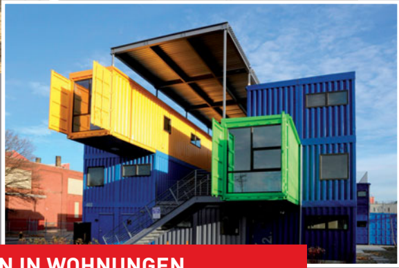
UMBAU VON CONTAINERN IN WOHNUNGEN