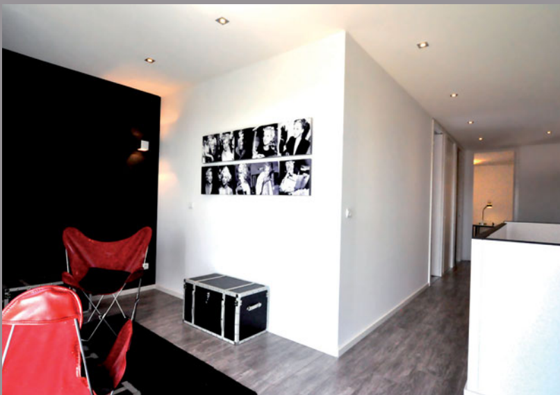
Musterhaus Modulife (Frankreich) - Wände und Decken von CLIPSO Durchführung: Unternehmensgruppe MCP, MODULIFE-Technologie